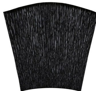
Удължаване до 60%

Качеството и характеристиките на материалите остават непроменени за дълъг период от време. Въпреки това се препоръчва продуктът да се използва в рамките на 12 месеца от датата на производство. Продуктът трябва да се съхранява в оригинална и неотворена опаковка на сухо и добре проветриво място при температура между + 5 °C и + 40 °C. Съхранението над 50 °C може да доведе до трудности при отстраняване на освобождаващата обвивка при нанасяне. Продуктът не се влияе от замръзване.